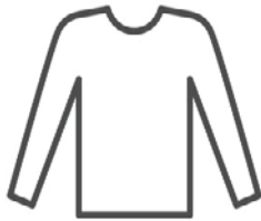
CAMISA MANGA LARGA en lana o algodón, no sintético